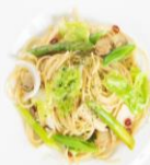
帆立と彩り野菜の ペロンチーノ ¥1,300