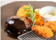
ハンバーグ&グリルフライ —デミグラスソース— ¥1,800