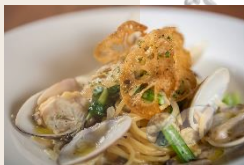
茨城県産はまぐりのクリームパスタ ¥1,800