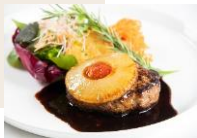
ハンバーグ焼パイナップル添え —デミグラスソース&トマトソース— ¥1,300