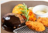
ハンバーグ & 牡蠣フライ デミグラスソース ¥1,800