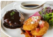
ハンバーグ & 焼いもクロquette デミグラスソース ¥1,500