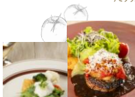
ハンバーグ おろしポン酢ソース ¥1,200