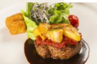
ごろっとパイナップルハンバーグ デミグラスソース & トマトソース ¥1,400